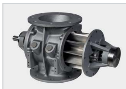
Versioni a smontaggio rapido Fast opening versions