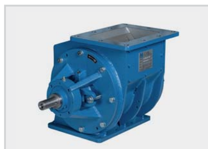
LSE_ Valvole rotative per granuli – 1 bar Rotary valves for pellets – 1 bar