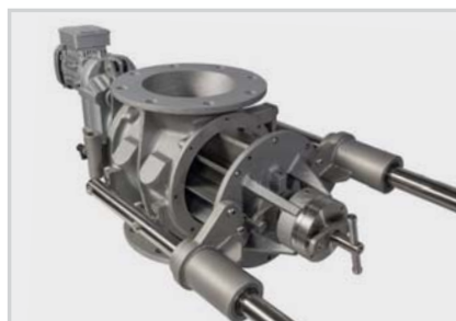
Versioni con guide di estrazione Versions with supporting bars