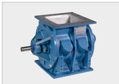
DC_ Valvole rotative – 0,1 bar Rotary valves – 0,1 bar