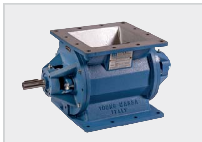
LDC_ Valvole rotative – 0,1 bar Rotary valves – 0,1 bar