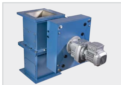
SA_ Valvole a doppio clapet Double flap gate valves