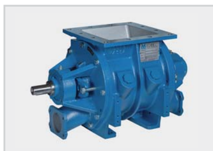
LBT_ Valvole rotative a flusso attraversato – 1 bar Blow-thru Rotary valves – 1 bar