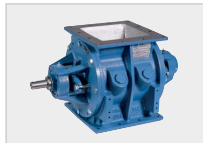
LDT_ Valvole rotative – 1 bar Rotary valves – 1 bar